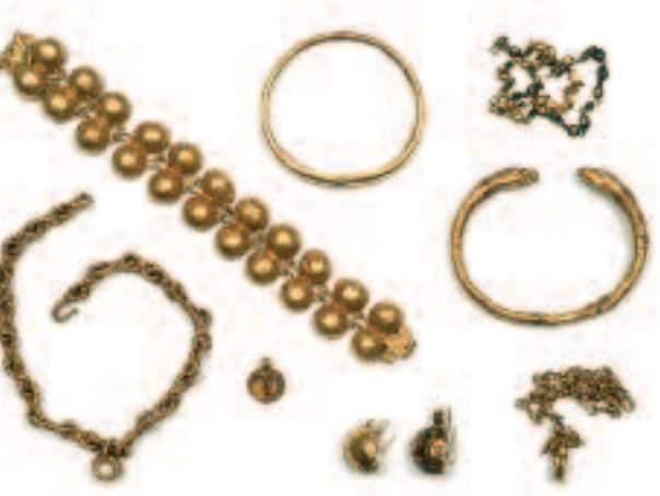
Bijoux de Boscoreale. 1 er siècle.