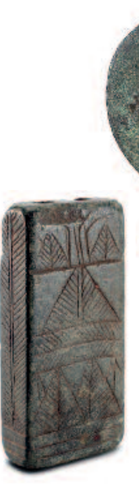
Étui à cosmétiques. 1 er siècle av. J.-C. - 5 e siècle apr. J.-C.