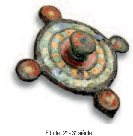
Fibule. 2 e -3 e siècle.