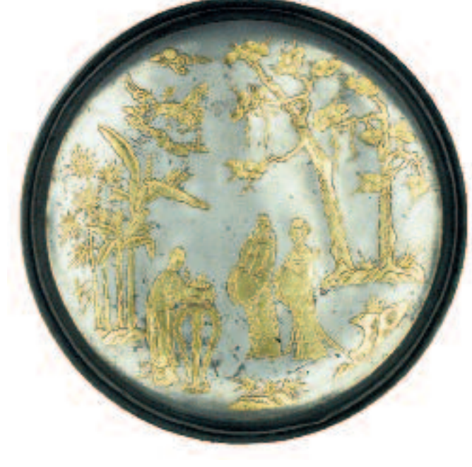
Offrande d'encens à la lune (boîte en étain). Chine. 18 e siècle.