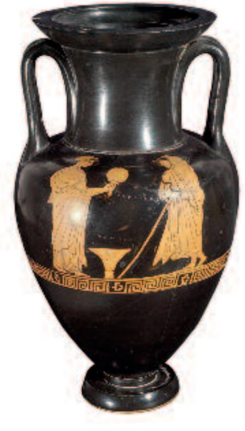
Amphore. 475-450 av. J.-C.