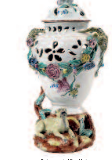
Pot-pourri. 18 e siècle.