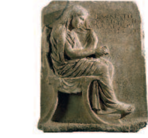
Stèle de Socrate (et détail). Fin du 5 e siècle av. J.-C. Inscription datant du 2 e siècle apr. J.-C.