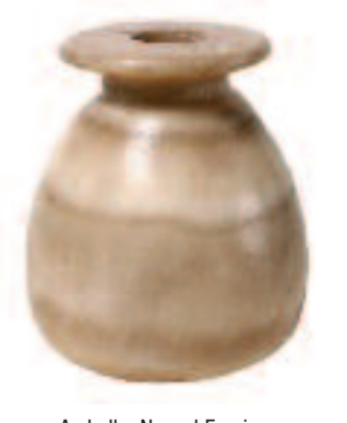
Aryballe. Nouvel Empire.