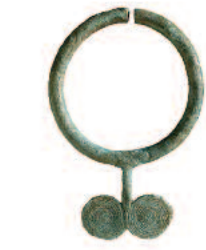
Boucle d'oreille en bronze. Asie du Sud-Est. 1 er millénaire av. J.-C.