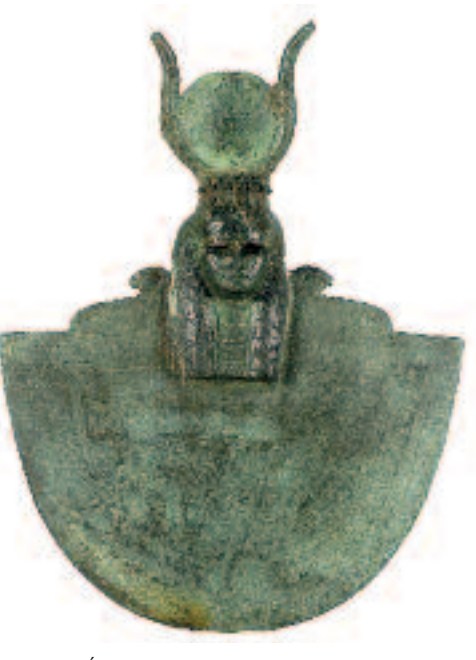
Egide d'Hathor. XXII e -XXX e dynastie.