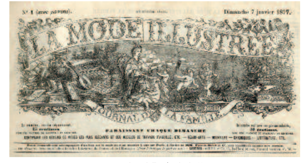
La mode illustrée 7 janvier 1877.