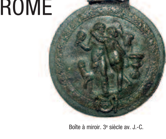
Boîte à miroir. 3 e siècle av. J.-C.