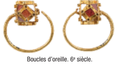
Boucles d'oreille. 6 e siècle.