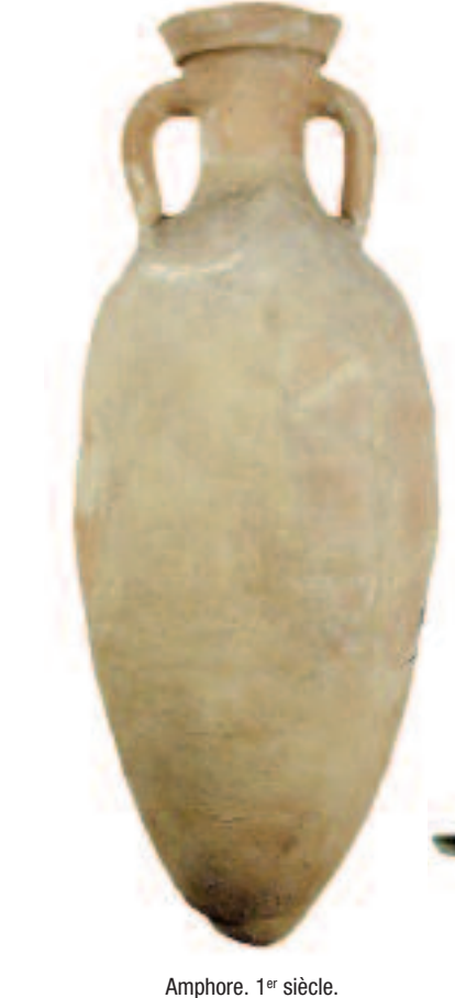
Amphore. 1 er siècle.