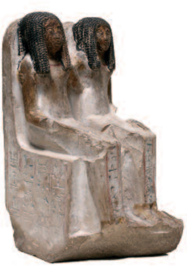
Groupe de Hetep et Moutouy. Début de la XVII e dynastie.