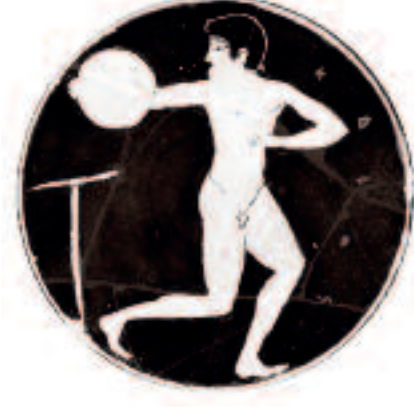
Coupe (détail). 510-500 av. J.-C.