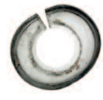
Boucle d'oreille en cristal de roche. Asie du Sud-Est. 1 er millénaire av. J.-C.