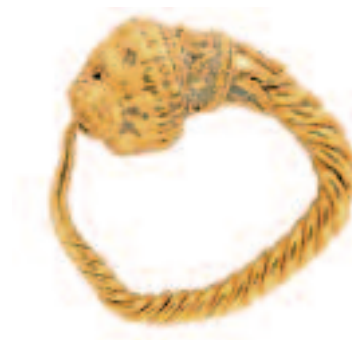
Boucle d'oreille. Période hellénistique.