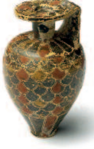
Aryballe. 7 e siècle av. J.-C.