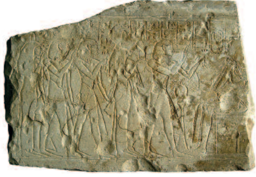
Scène d'offrande à Amenhotep III e . XIX e dynastie.