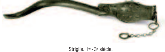
Strigile. 1 er -3 e siècle.