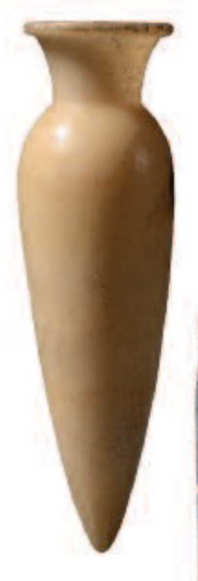
Atabastre. Ancien Empire.