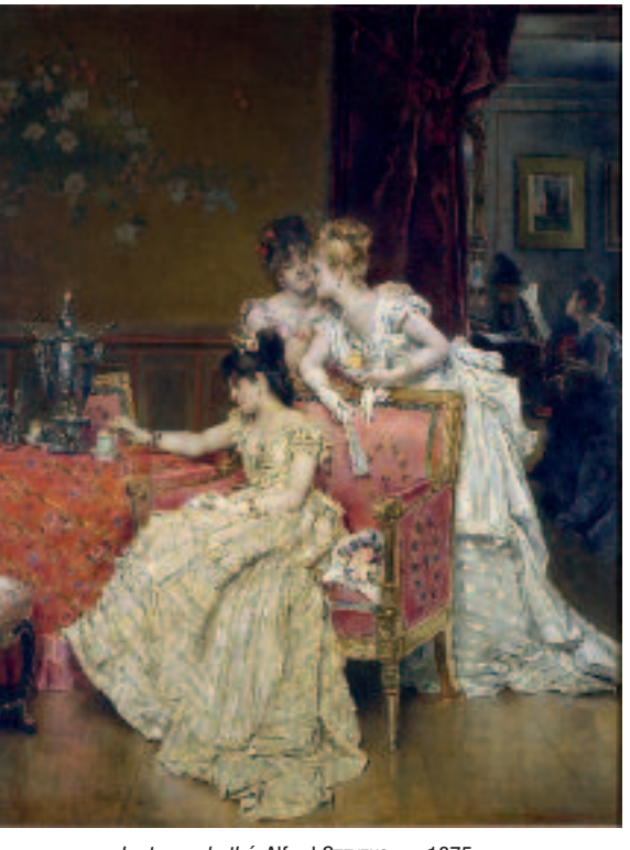
La tasse de thé. Alfred Stevens, ca 1875.