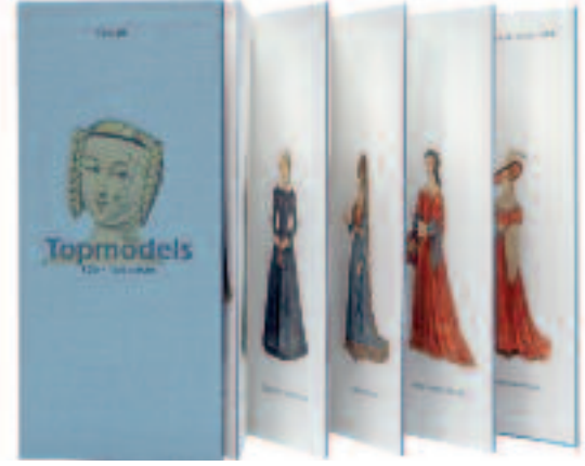
Top models. Collection Citwalk. Ute Kuhl. 2008.

5000 ANS DE PARFUMS ET BEAUTÉ AU MUSÉE ROYAL DE MARIEMONT