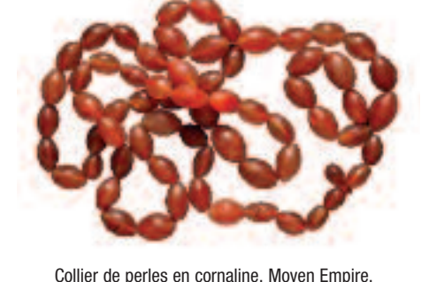
Collier de perles en cornaline. Moyen Empire.