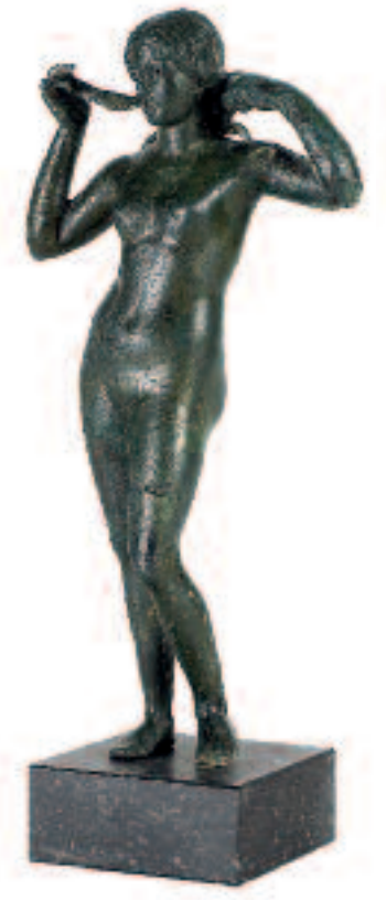
Vénus sortant de l'onde. 1 er -2 e siècle.