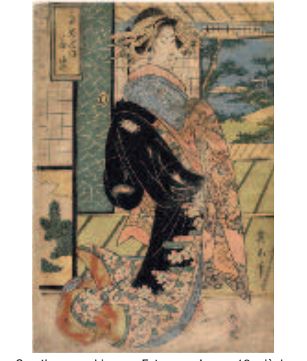
Courtesane en kimono. Estampe. Japon. 19 e siècle.