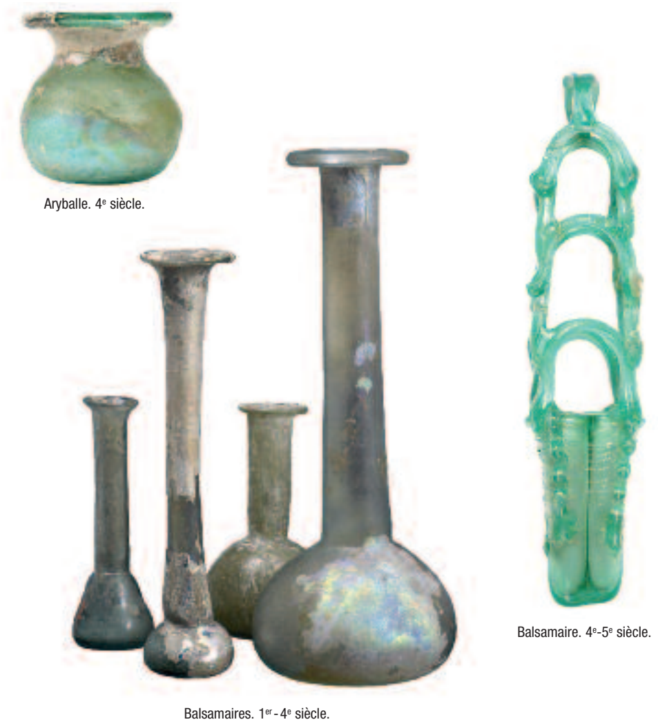
Aryballe. 4 e siècle.