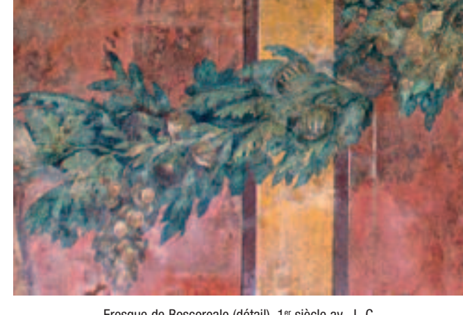
Fresque de Boscoreale (détail). 1 er siècle av. J.-C.