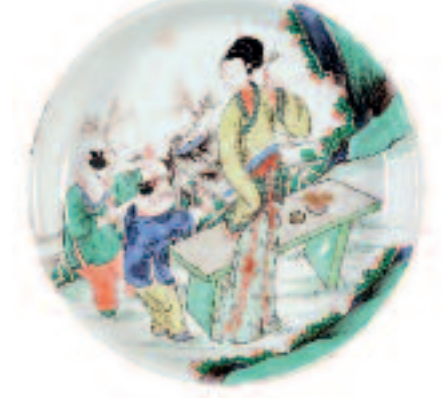
Scène de jardin (plat en porcelaine). Chine. Vers 1700.