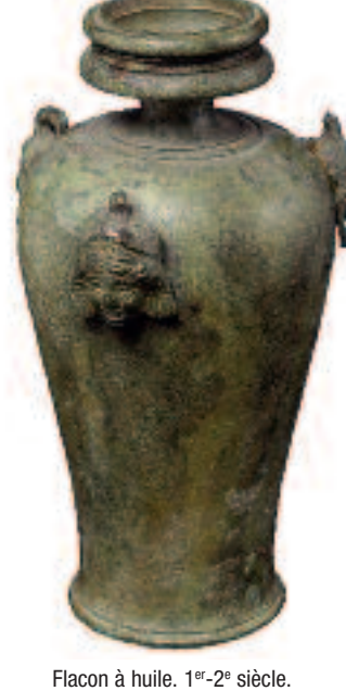
Flacon à huile. 1 er -2 e siècle.