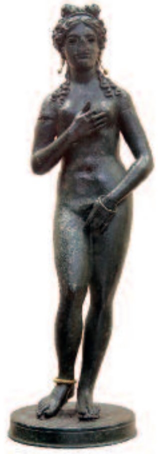
Aphrodite pudique. Copie romaine d'un original du début du 3 e siècle av. J.-C.