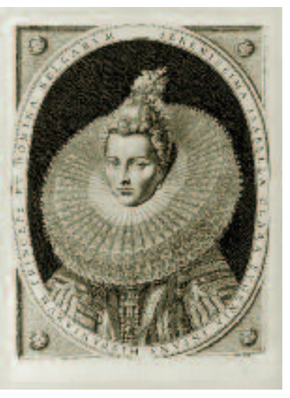
Portrait en médaillon de l'enfante Isabelle. 17 e siècle.