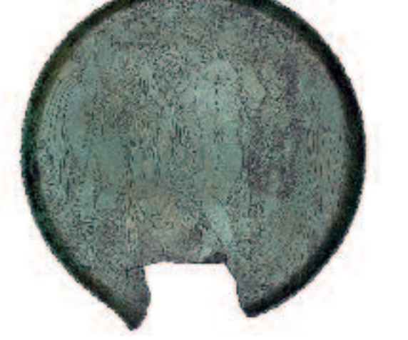
Miroir orné d'une scène mythologique, avec Hercule et Minerve entourés de Thétis et Éris. 4 e siècle av. J.-C. Dessin d'après R. LAMBERTS, Corpus Speculorum Etruscorum, Rome, 1987, n° 25, p. 43-46, ill., p. 141-145.