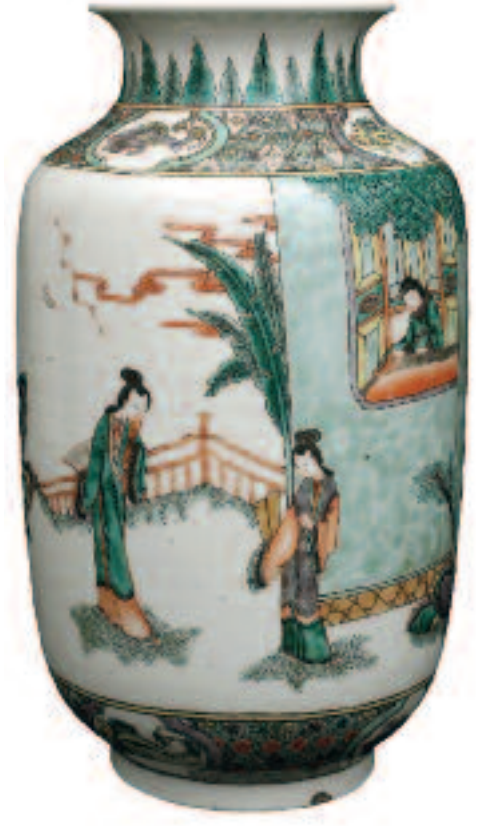
Scène galante (vase en porcelaine). Chine. Vers 1700.