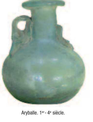
Aryballe. 1 er -4 e siècle.