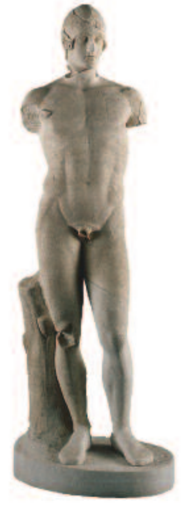
Statue dite de «L'Arès Sommeil». 5 e siècle av. J.-C.