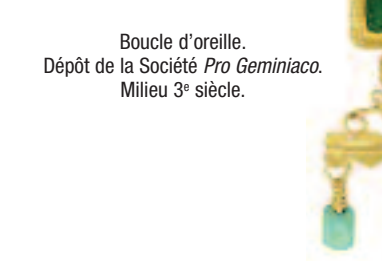
Boucle d'oreille. Dépôt de la Société Pro Geminao Milleu 3 e siècle.