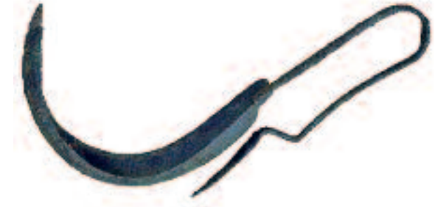
Strigile. 5 e siècle (fin)-4 e siècle (début) av. J.-C.