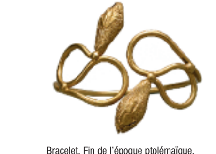
Bracelet. Fin de l'époque ptolémaïque.