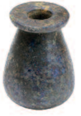
Vase. XVIII e dynastie.