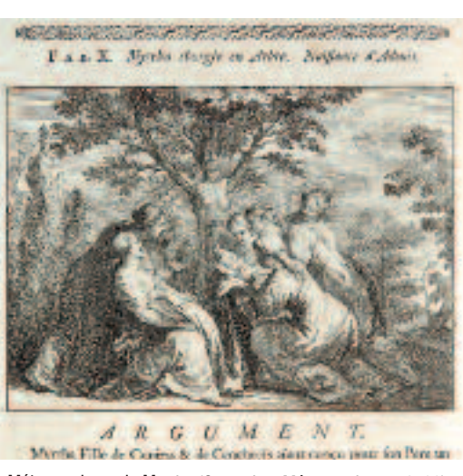
Métamorphose de Myrrha (Ovide). Les Métamorphoses. 1730.