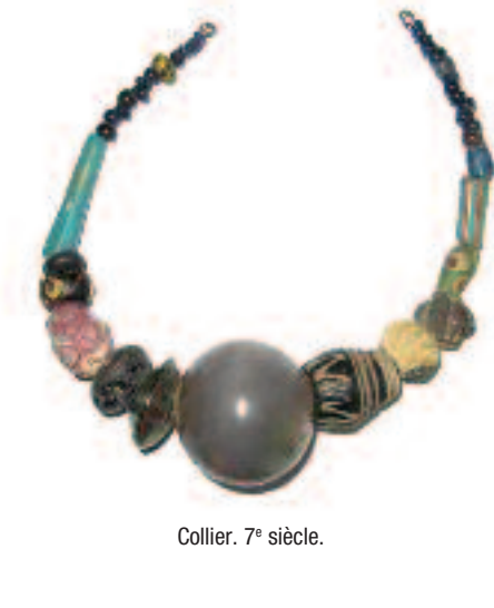
Collier. 7 e siècle.