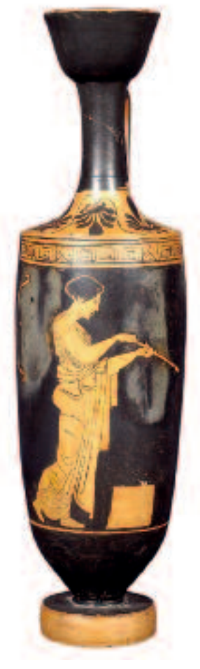
Lyciote. Environ 430 av. J.-C.