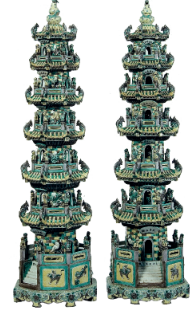
Brûle-parfums en porcelaine. Chine. Vers 1700.