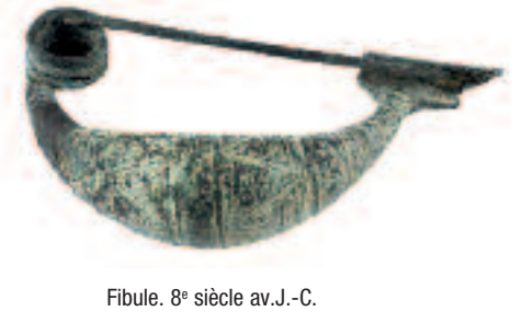
Fibule. 8 e siècle av. J.-C.