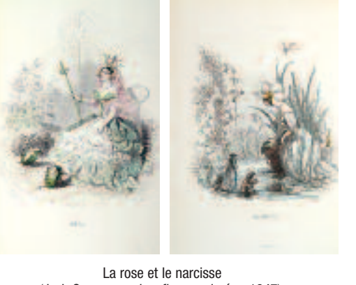
La rose et le narcissus (J.-J. GRANVILLE, Les fleurs animées. 1847).