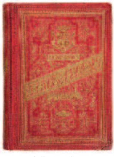
Le livre des parfums. Eugène Penel. [s.d.]