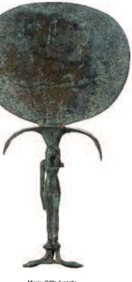
Miroir. XVIII e dynastie.