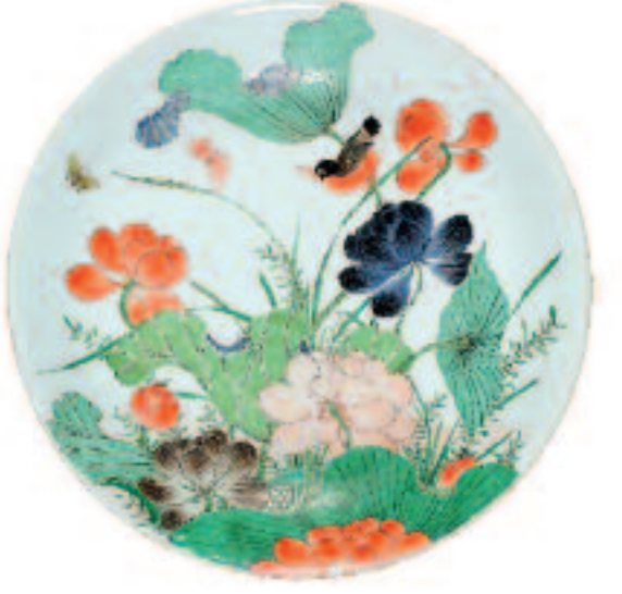
Lotus (plat en porcelaine). Chine. Vers 1700.