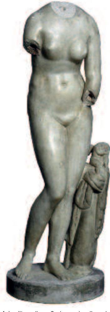
Aphrodite pudique. Copie romaine d'un original du début du 3 e siècle av. J.-C.