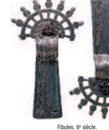
Fibules. 6 e siècle.