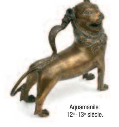
Aquamante. 12 e -13 e siècle.