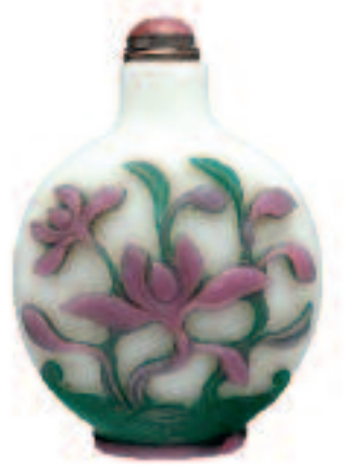
Facon à priser en verre. Chine. 18 e siècle.