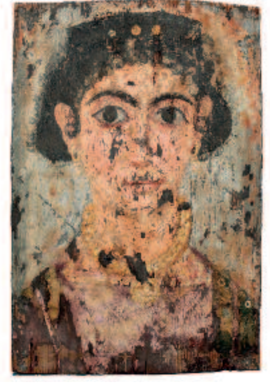
Portrait de momie. Fin du 3 e -début du 4 e siècle.