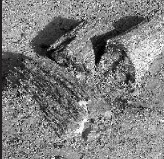
Bois fossile près des pyramides de Nuri