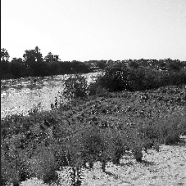
Cataracte au Soudan © J. Boël.