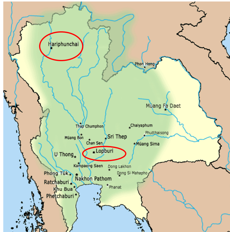
Aire du « royaume » de Dvâravatî

A partir du 6 e siècle et jusqu'au 11 e siècle, des « royaumes » ou en tout cas des entités politiquement organisées se sont formés dans et autour du Golfe de Thaïlande, permettant ainsi à la culture indienne de rayonner vers le nord en remontant tout simplement les cours d'eau, voies de circulation des hommes et des biens, donnant accès à l'intérieur des terres.