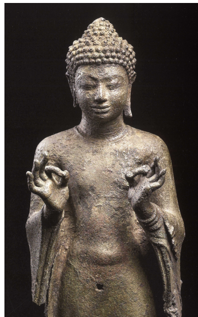
Bouddha debout - Bronze - H. 51 cm - Nonthaburi - c. 8 e s. (Bangkok, Musée national)

Un autre chef d'œuvre, en bronze celui-là, découvert dans la crypte d'un stûpa de la province de Nonthaburi (centre) et datant probablement du 8 e siècle, est une statue du Bouddha debout, effectuant des deux mains le geste de l'argumentation ( vitarka mudra ). Ce geste était vraisemblablement aussi celui du Bouddha du Wat Na Phra Men d'Ayutthaya. Les caractéristiques du visage, tout aussi doux et juvénile, sont similaires.