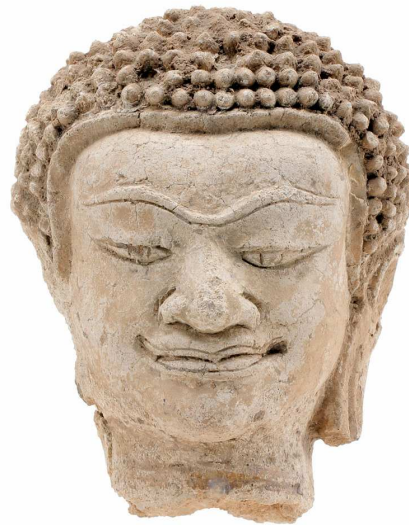
Tête de Bouddha - Stuc - H. 17 - Thaïlande (Lamphun) - Fin 12 e - 13 e s. Musée royal de Mariemont (Inv. Ac. 69/5)

Les deux têtes datent de la fin du 12 e ou du début 13 e siècle, et si elles ont en commun le front très large, la chevelure ourlée d'un filet en relief, la face ronde aux joues pleines et la bouche aux coins légèrement relevés, soulignée d'un liseré incisé, l'impression générale qui s'en dégage est fort différente. La petite tête en stuc affiche clairement ses origines mônes (D'origine austro-asiatique, les Mônes ont occupé une partie de la Birmanie et de la Thaïlande avant l'arrivée des Thaïs), tandis que la tête en grès témoigne tout aussi clairement d'une forte influence de l'art khmer , dont le puissant royaume se dressait plus à l'est. Vous les présenter simultanément me permettra d'évoquer l'art bouddhique de l'actuelle Thaïlande avant l'arrivée des Thaïs - ceux-ci n'arrivant progressivement du sud de la Chine qu'à partir du début du 13 e siècle précisément.