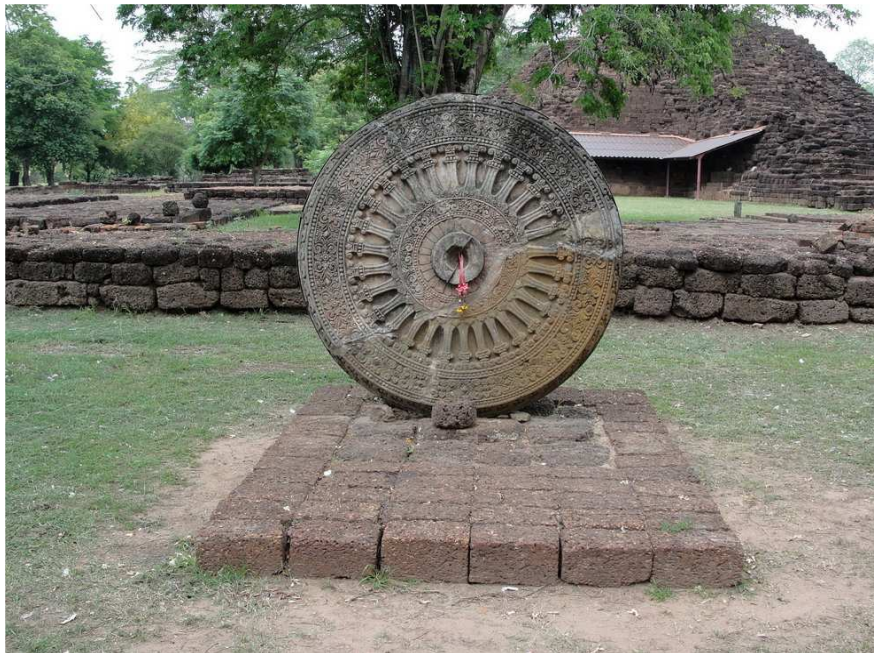
Roue de la Loi ( Dharmacakra ) dans le parc archéologique de Si Thep

Les œuvres les plus représentatives de l'art bouddhique de Dvâravatî sont les Roues de la Loi ( Dharmacakra ), en fin calcaire gris ou en grès (selon les régions). Symboles du monarque universel cakravartin dans l'hindouisme, ces roues sont considérées dans le bouddhisme comme celui de la propagation de la Loi bouddhique dans toutes les directions. Les Dharmacakra couronnaient le sommet de hauts piliers, ce qui fait évidemment songer aux fameux piliers d'Ashoka (304 - 232 avt. n.e.) de l'époque Maurya en Inde 4 .