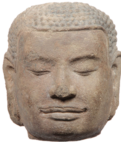
Tête de Bouddha - Grès - H. 16 Thaïlande (Style de Lopburi) - Fin 12 e - 13 e s. Musée royal de Mariemont (Inv. Ac. 2012/36)