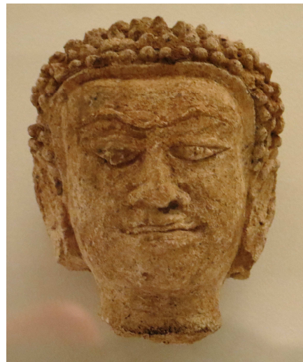
Deux têtes de Bouddha (MA129 et MA3299) - Stuc - Région de Lamphun 12 e - 13 e s. (Paris, Musée national des Arts asiatiques - Guimet)