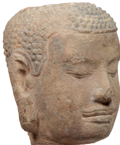
Détail de la statue présumée de Jayavarman VII (Paris, Musée Guimet) et tête de Bouddha de Lopburi (Musée royal de Mariemont, Ac. 2012/36)