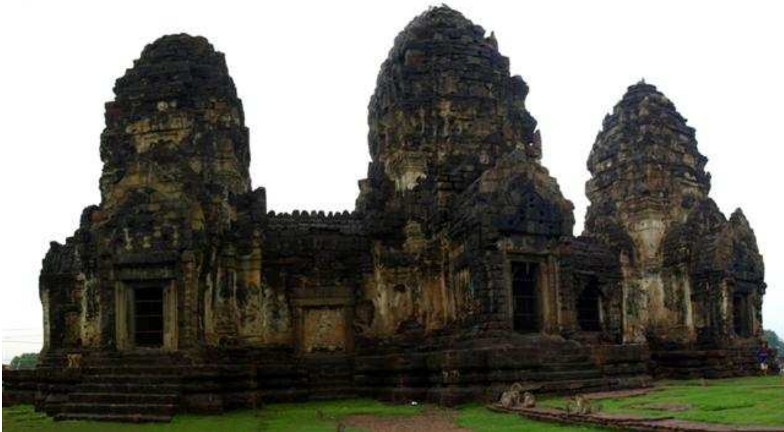
Les trois sanctuaires du Phra Prang Sam Yod à Lopburi - fin 12 e - début 13 e s.

Lorsque Jayavarman VII (r. 1181 - 1218), restaurateur de la puissance khmère après le passage meurtrier des Cham à Angkor en 1177, monta sur le trône, il édifia une nouvelle capitale, Angkor Thom, au cœur de laquelle se dresse le temple mahâyâniste du Bayon consacré à Avalokiteshvara, couronné de tours à visages. A Lopburi, alors territoire khmer, des temples comme le Phra Prang Sam Yod furent édifiés dans le style du Bayon.