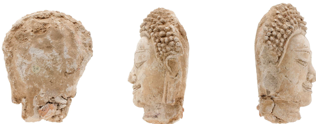
Tête de Bouddha en stuc - H. 17 - Région de Lamphun - Fin 12 e - 12 e s. (Musée royal de Mariemont, Inv. Ac. 69/5)

La petite tête en stuc de nos collections provient certainement d'une telle niche ou frise décorative. Son revers est plat, non modelé et le profil est lui aussi aplati, la tête devant seulement être vue de face. Il ne nous est évidemment pas possible de savoir si l'œuvre provient d'un monument relevant du Theravâda - où l'on trouvait uniquement des représentations du Bouddha, des scènes de jâtaka (vies antérieures du Bouddha) et d' avadâna (contes dans lesquels des actions méritoires passées sont mises en relation avec des événements ultérieurs) ou bien si elle provient d'un monument mahâyâniste, où l'on rencontrait également des Bodhisattvas, des devatâ et d'autres créatures célestes. Les deux écoles étaient en effet présentes dans le pays.