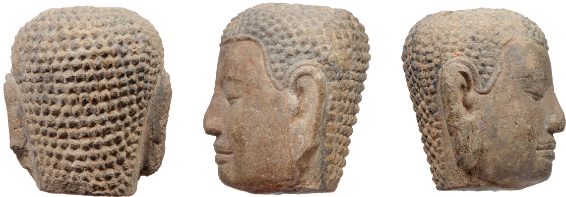
Tête de Bouddha - Pierre - H. 16 - Style de Lopburi - Fin 12 e -13 e siècle (Musée royal de Mariemont, Ac. 2012/36)

Tout, dans la douceur du modelé et des traits du visage, indique l'influence khmère. Si l'on compare la petite tête de Mariemont au visage de ce chef-d'œuvre absolu de l'art khmer qu'est le portrait présumé de Jayavarman VII en méditant, conservé au Musée Guimet, apparaît clairement ce qui unit et sépare un art de cour et un art provincial, l'œuvre parfaitement équilibrée, dont la pierre est soigneusement polie et le petit Bouddha recueilli de Lopburi.