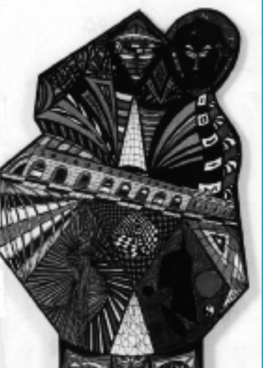
Henry Bauchau, Le couple .

Cette exposition met à l'honneur le doyen des lettres belges dont on célébrera le centenaire de la naissance en 2013. Cet homme à l'extraordinaire longévité de plume a traversé le 20 e siècle et représente actuellement une des figures majeures de la littérature belge.