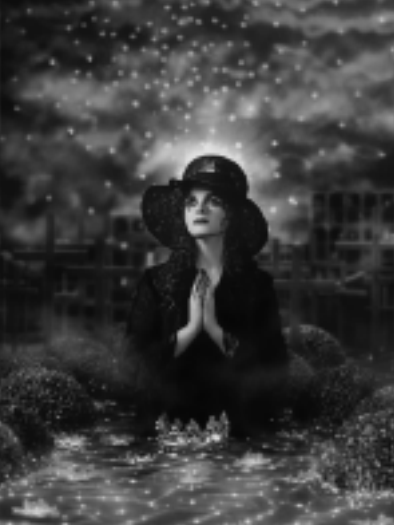
Bloody Amélie, 2008. © Pierre et Gilles Courtesy Galerie Jerome de Noirmont.

L'écrivain fait partie de notre imaginaire collectif. Il est une figure majeure de notre histoire moderne et un reflet de nos préoccupations sociales, intimes, politiques ou sacrées.