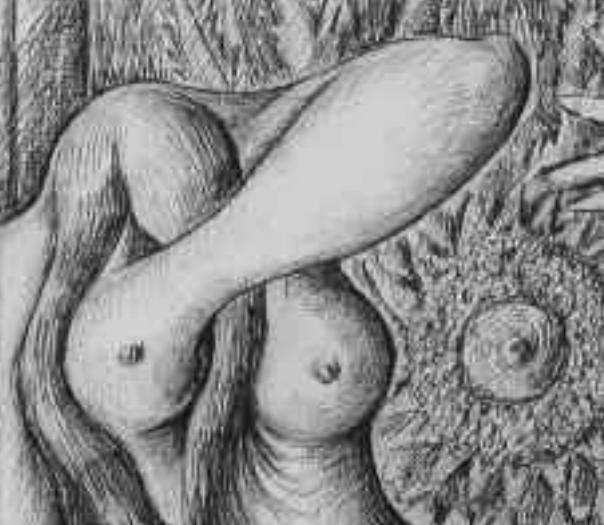
Simon, La colère végétale. coll. privée