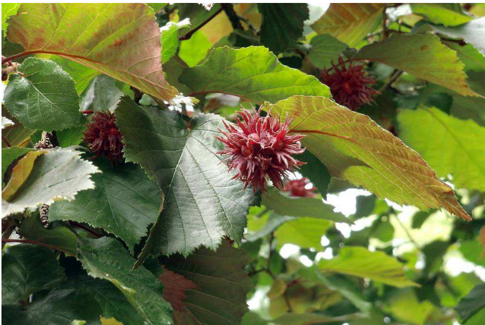
13. Corylus colurna 'Te Terra Red'