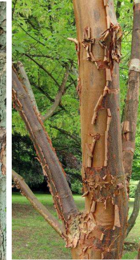
23. Acer griseum