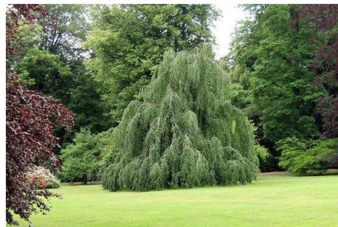
33. Fagus sylvatica 'Pendula'