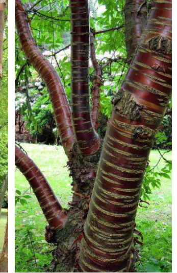
29. Prunus serrula