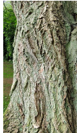
28. Phellodendron amurense