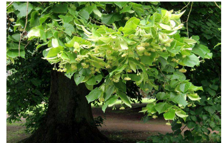
12. Tilia platyphyllos : Tilleul / Linde