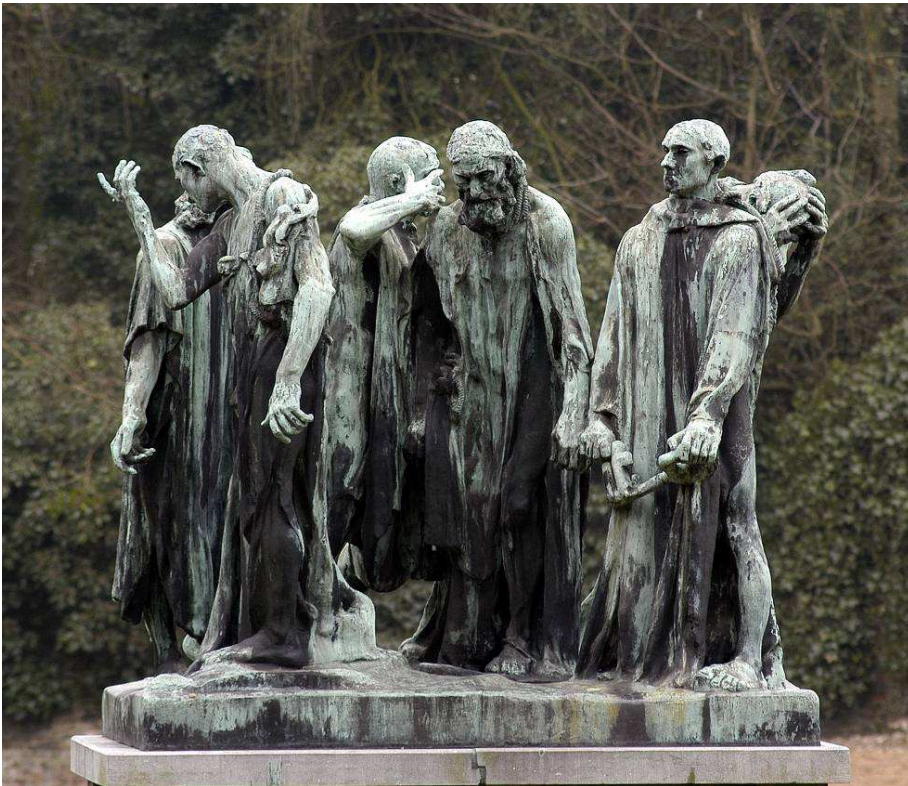
Les Bourgeois de Calais - De burgers van Calais (Rodin)