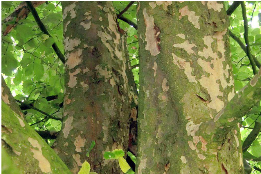
27. Parrotia persica