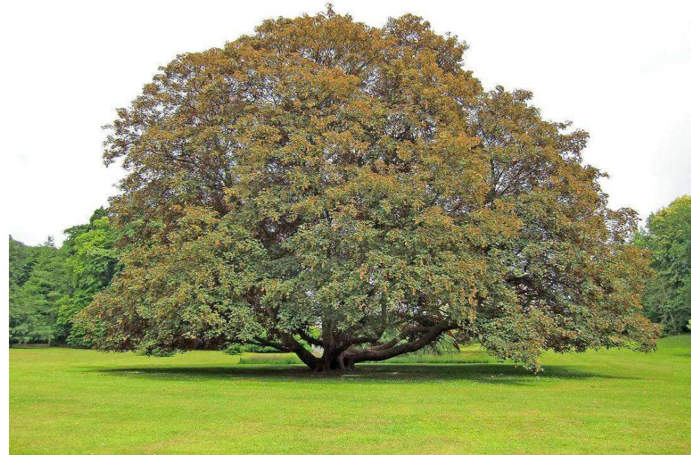
2. Acer pseudoplatanus 'Atroapiniea'