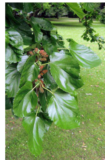
19. Monus Alba