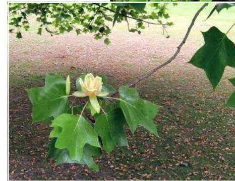
8. Liriodendron tulipifera