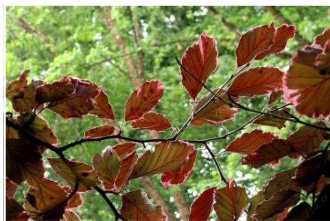
14. Fagus sylvatica 'Roseomarginata'