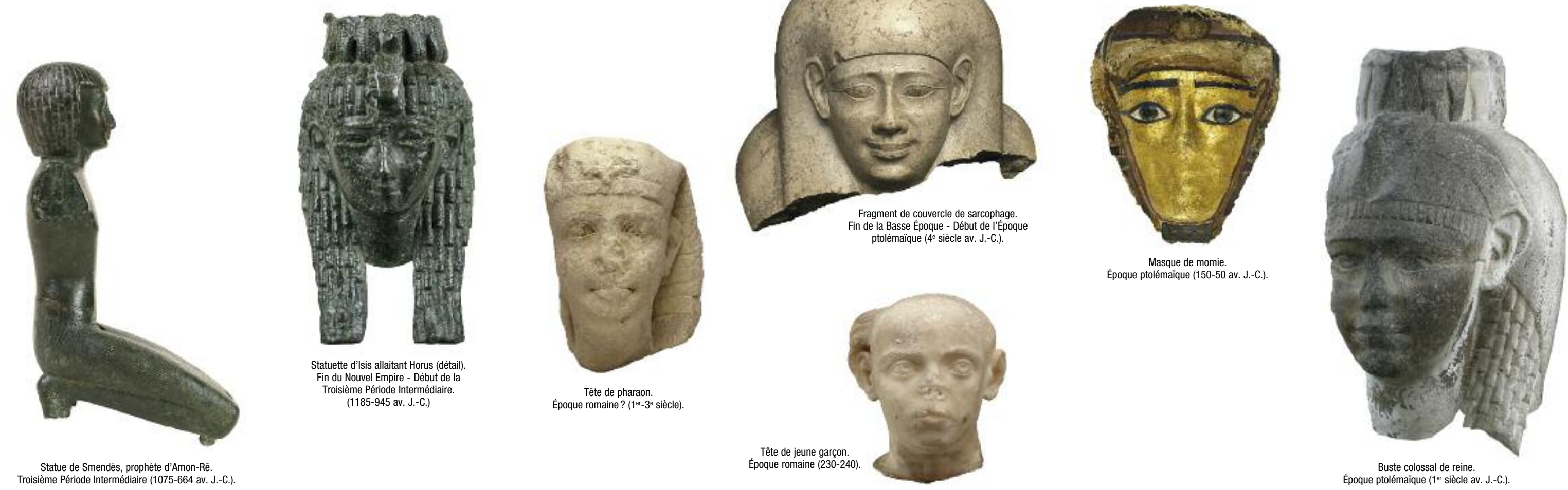
Statue de Smeret, prophète d'Amon-Ré. Troisième Période Intermédiaire (1075-664 av. J.-C.). Statue de l'isais allaitant Horus (détail). Fin du Nouvel Empire - Début de la Troisième Période Intermédiaire. (1185-945 av. J.-C.). Tête de pharaon. Époque romaine? (1 er -3 e siècle). Fragment de couvercle de sarcophage. Fin de la Basse Époque - Début de l'Époque ptolémaïque (4 e siècle av. J.-C.). Masque de momie. Époque ptolémaïque (150-50 av. J.-C.). Buste colossal de reine. Époque ptolémaïque (1 er siècle av. J.-C.). Tête de jeune garçon. Époque romaine (230-240).