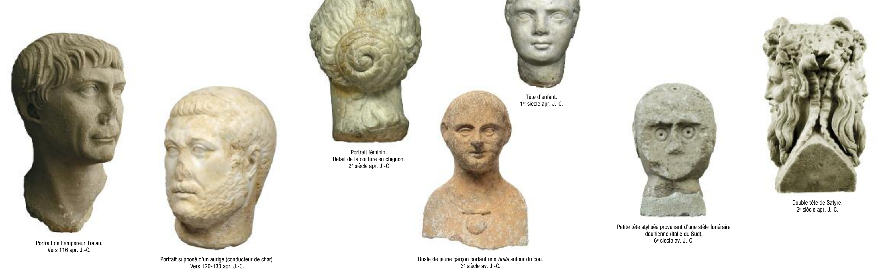
Portrait de l'empereur Trajan. Vers 116 apr. J.-C. Portrait supposé d'un aurige (conducteur de char). Vers 120-130 apr. J.-C. Portrait féminin. Détail de la coiffure en chignon. 2 e siècle apr. J.-C. Tête d'enfant. 1 er siècle apr. J.-C. Petite tête stylisée provenant d'une stèle funéraire daurienne (Italie du Sud). 6 e siècle av. J.-C. Double tête de Satyre. 2 e siècle apr. J.-C.