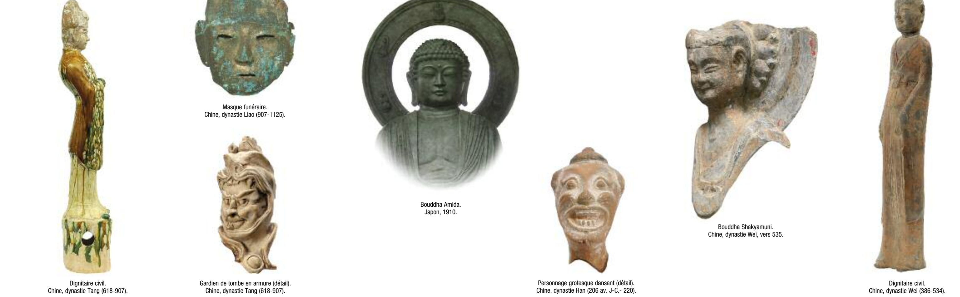
Figurine civil. Chine, dynastie Tang (618-907). Masque funéraire. Chine, dynastie Liao (907-1125). Bouddha Amida. Japon, 1910. Personnage grotesque dansant (détail). Chine, dynastie Han (206 av. J.-C. - 220). Bouddha Shakyamuni. Chine, dynastie Wei, vers 535. Figurine civil. Chine, dynastie Wei (386-534).