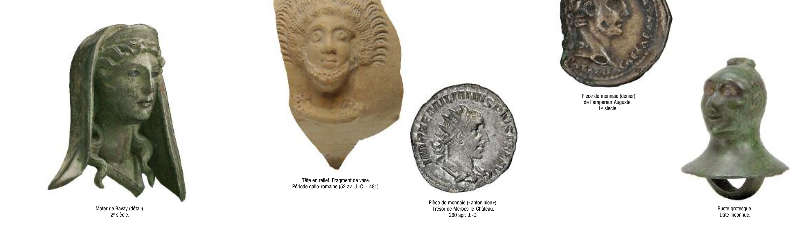
Mater de Bavay (détail). 2 e siècle. Tête en relief. Fragment de vase. Période gallo-romaine (52 av. J.-C. - 481). Pièce de monnaie (=antoninien-). Trésor de Menthé-le-Château. 260 apr. J.-C. Pièce de monnaie (denier) de l'empereur Auguste. 1 er siècle. Buste grotesque. Date inconnue.