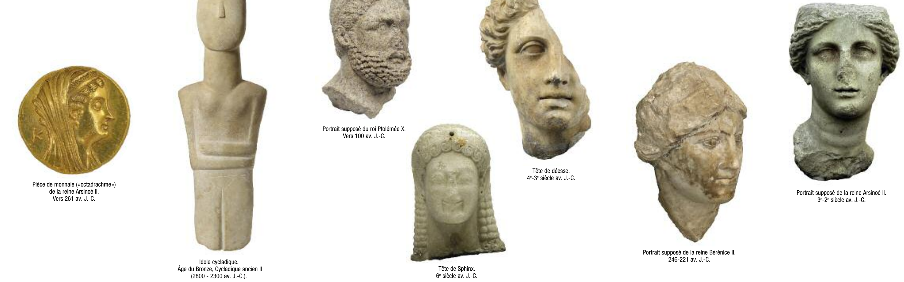
Pièce de monnaie (=octadrachme-) de la reine Arsinoé II. Vers 261 av. J.-C. Idole cycladique. Âge du Bronze, Cyclades/Égée ancien II (2800 - 2300 av. J.-C.). Portrait supposé du roi Ptolémée X. Vers 100 av. J.-C. Tête de déesse. 4 e -3 e siècle av. J.-C. Tête de Sphinx. 6 e siècle av. J.-C. Portrait supposé de la reine Arsinoé II. 3 e -2 e siècle av. J.-C. Portrait supposé de la reine Bérénice II. 246-221 av. J.-C.